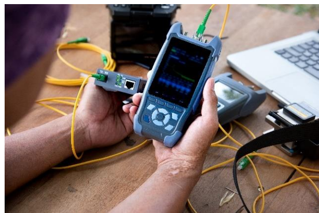
Figure 1: à gauche : soudeuse de fibre optique - à droite : un réflectomètre optique à domaine temporel (OTDR)